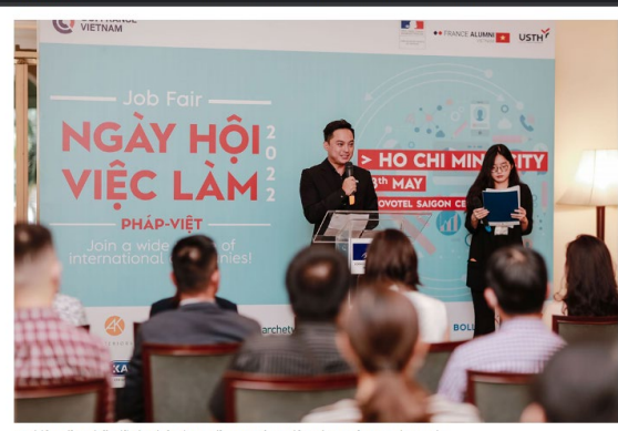
Sự kiện gần nhất đã thu hút được gần 800 ứng viên và 46 công ty tham gia.

Nam, dù là ngày hôi tuyển dụng của các doanh nghiệp Pháp nhưng ứng viên không nhất rời biết tiếng Việt, tiếng Anh và các ngoại ngữ khác. Mức lương sẽ tùy vào vị trí việc làm, í nhân viên hành chính hay mức lương 4.000 - 5.000 USD/tháng ở những vị trí quản lý.